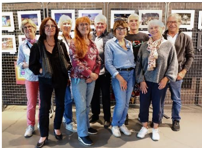
Le groupe lors d'une exposition photo à Saint Pée sur Nivelle

Le blog photo « ateliercl64 » sur le site clubmgen64.fr Jacques Beyris continue d'aider les photographes pour que le blog puisse continuer à être alimenté par leurs très belles réalisations.