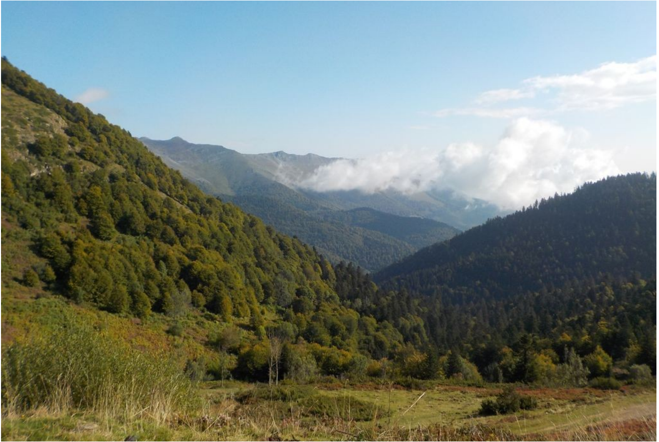
Le ciel est bien dégagé vers le nord.