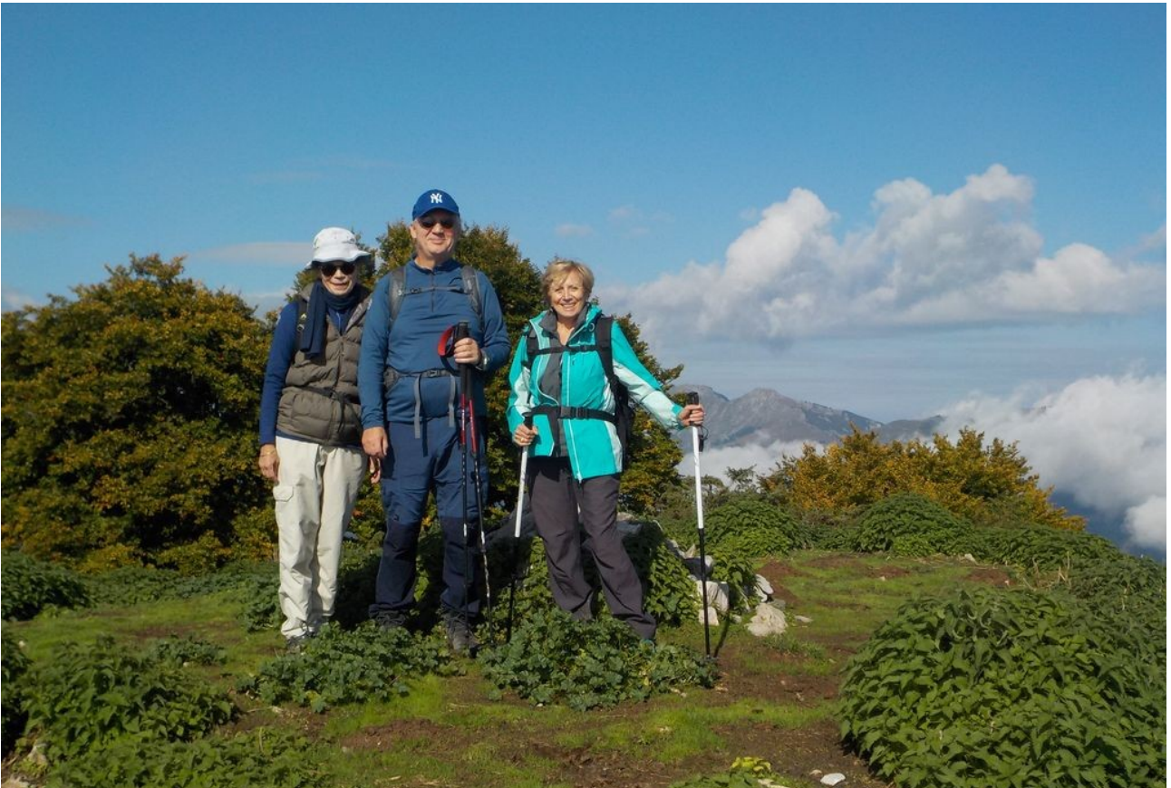
Domage, la vue est un peu cachée par les nuages vers Arrens-Marsous.