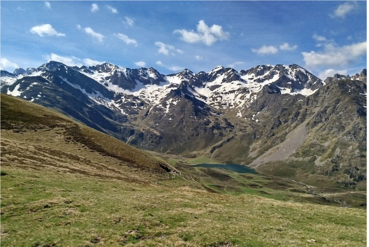
Et vers la plaine et le pic de la Moulata.