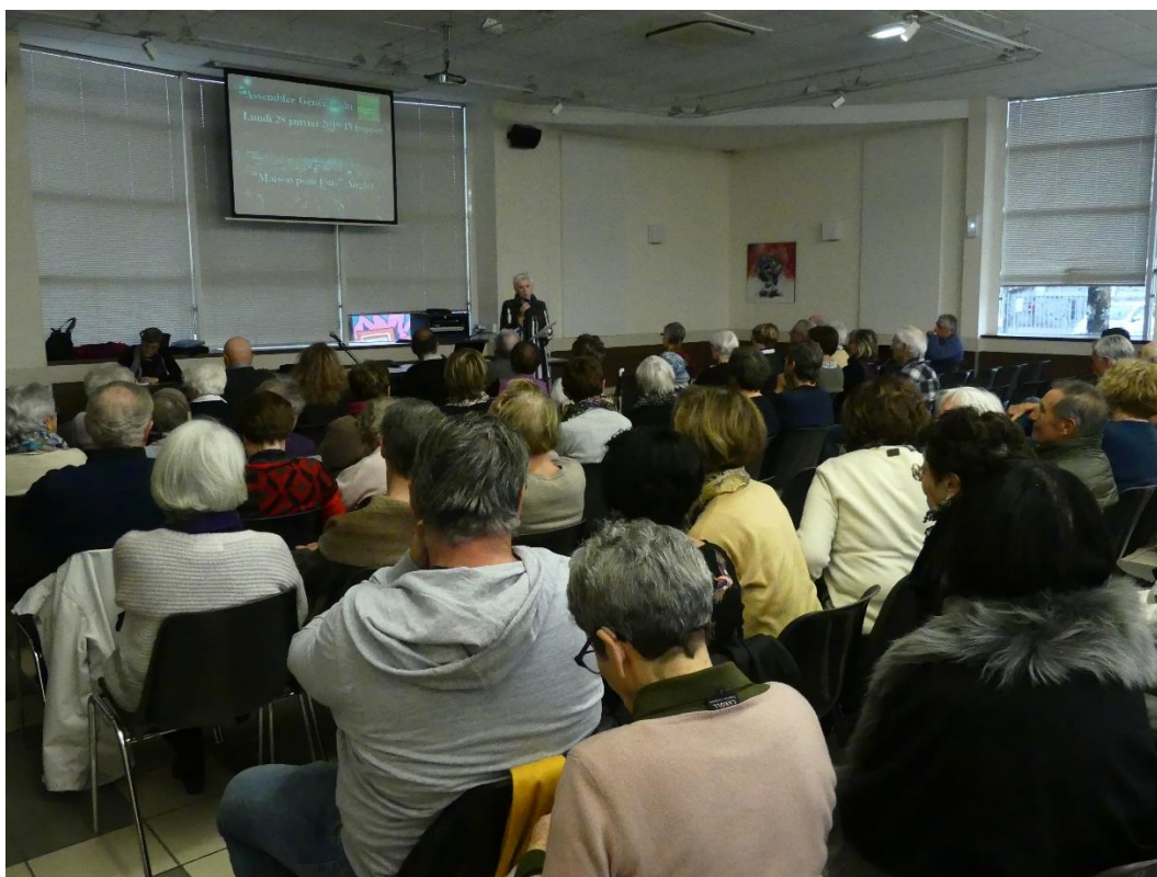
Une vue de l'assemblée